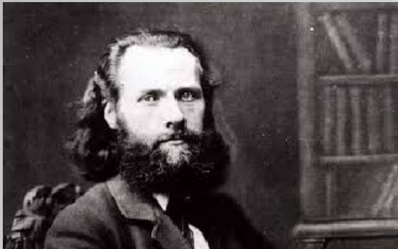
Ferdinand Domela Nieuwenhuis